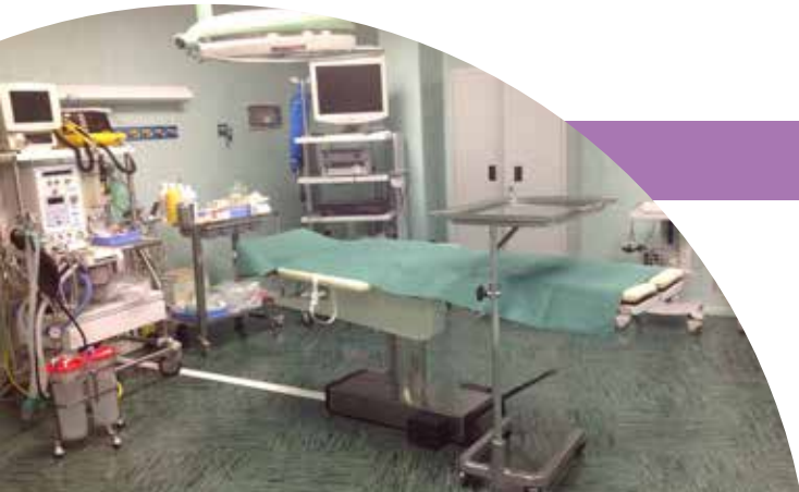
Centro New Life in Embryos - Saletta Operatoria

Il Day surgery è un complesso chirurgico con degenza esclusivamente diurna. Nel complesso è possibile eseguire interventi programmati che prevedano una ripresa postoperatoria rapida e che vede il paziente dimesso nello stesso giorno dell'intervento.