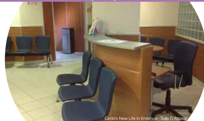
Centro New Life in Embryos - Sala D'Attesa

CENTRO DI FECONDAZIONE ASSISTITA Ambulatorio Polispecialistico - Day Surgery Chirurgia di giorno